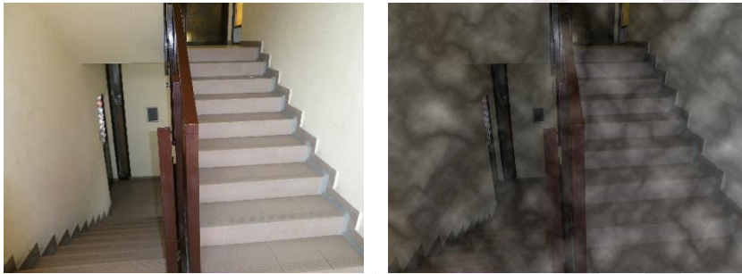
1. kép: Menekülési útvonal, a keletkező füst látást korlátozó hatása