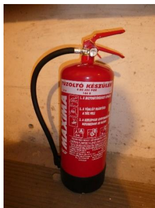
2. kép: Hordozható tűzoltó készülék