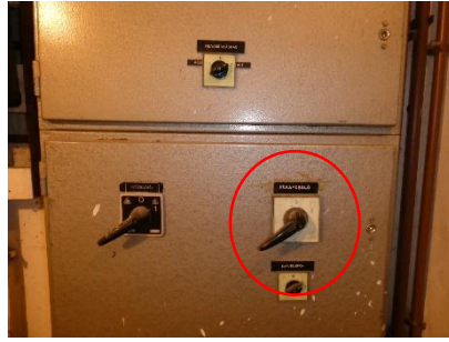
4. kép: Az épület tűzeseti főkapcsolója