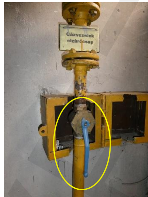
5. kép: A Társasház gáz főelzáró csapja